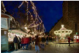
Hattingen im Lichterglanz

Adventliche Stadtführung durch die historische Altstadt und Weihnachtsmarkt